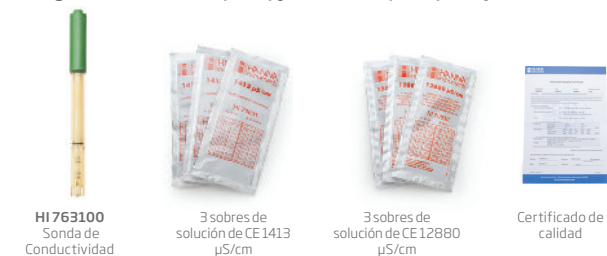
HI 763100 Sonda de Conductividad

El edge CE kit HI 2030-01 (115V) y HI 2030-02 (230V) incluyen: