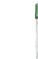
HI 11310 Unión doble, cerámica, rellenable, con sensor de temperatura interno y punta esférica

Recomendado para laboratorio y usos generales