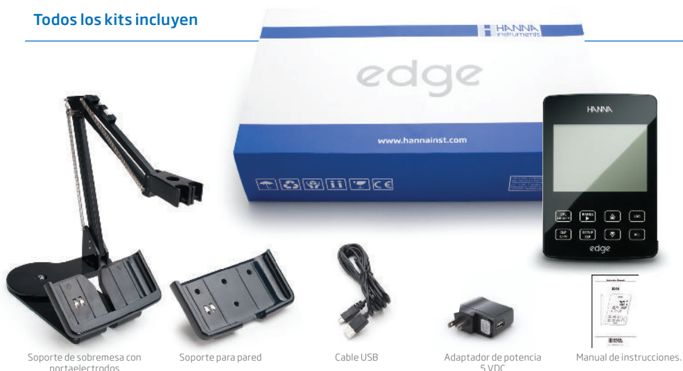
SopORTE de sobremesa con portaelectrodos