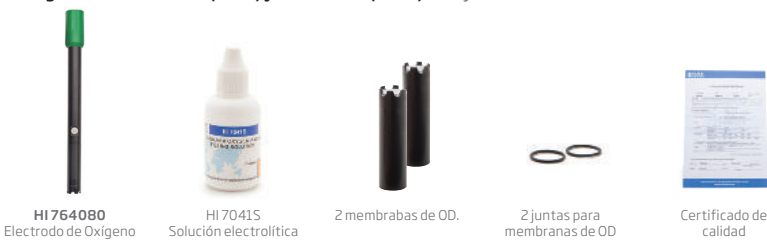
HI 764080 Electrodo de Oxígeno Disuelto

El edge OD kit HI 2040-01 (115V) y HI 2040-02 (230V) incluyen: