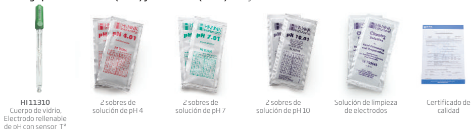
HI 11310 Cuerpo de vidrio, Electrodo rellenable de pH con sensor T°

El edge pH kit HI 2020-01 (115V) y HI 2020-02 (230V) incluyen: